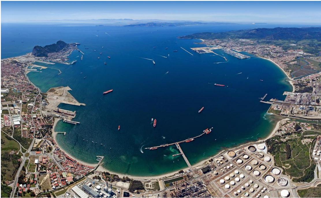
Fig. 1.- Vista general de la actual bahía de Algeciras (Cádiz).