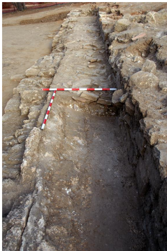
Fig.8.- Refuerzo, de época romana, en la base de la muralla púnica.