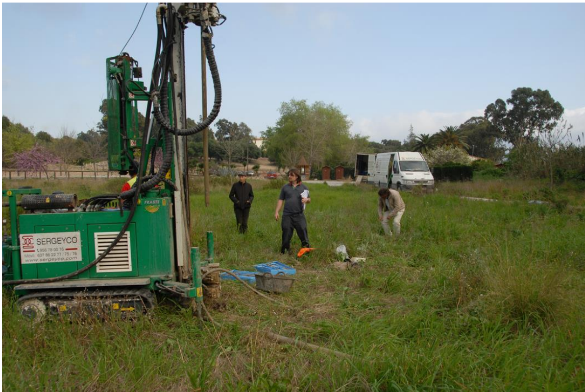
Fig. 4.- Materialización del sondeo S-3, extramuros de la urbe romana.