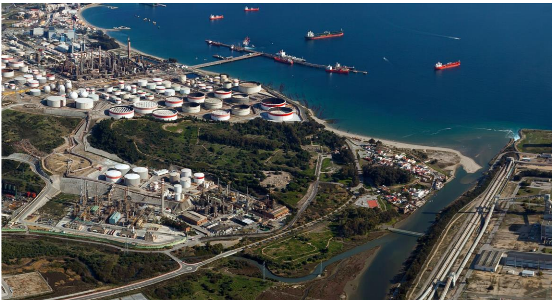
Fig.2.- Vista general de la urbe de Carteia (San Roque, Cádiz). © Proyecto Carteia-Paisajes Aéreos S.L. Foto J.C. Guzmán Espresati (2014).