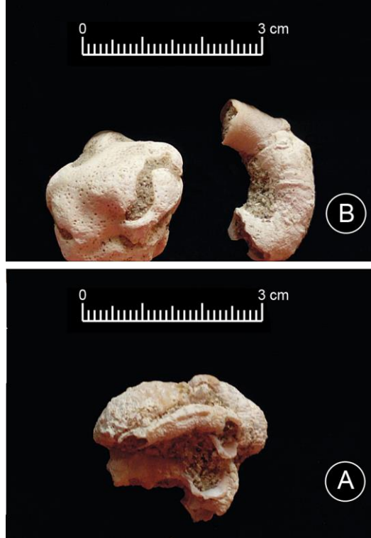
Fig. 7.- Muestras de Dendropoma petraeum del sondeo S-2.