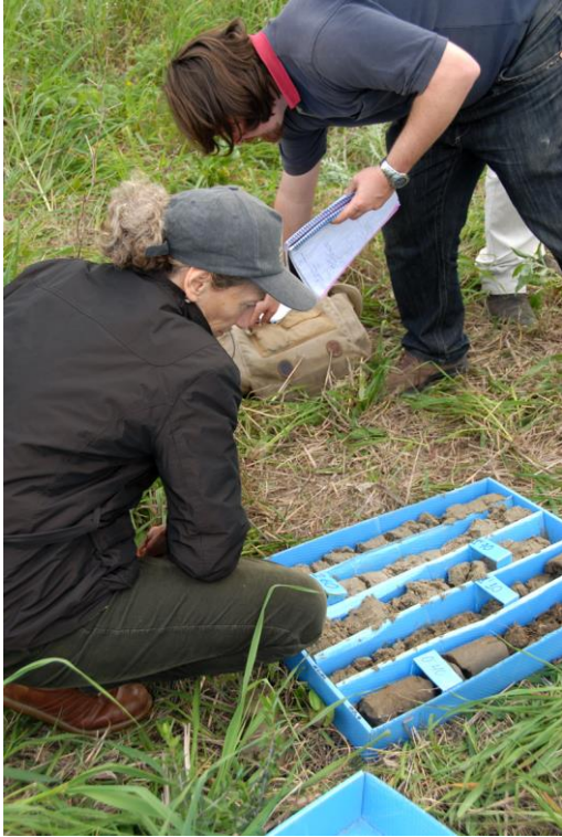
Fig. 6- Caja con el testigo del sondeo S-3.