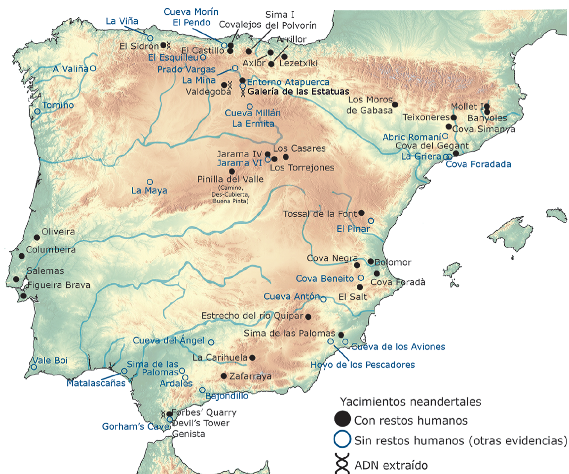
Figura 1. Mapa de la península Ibérica donde se señalan los principales yacimientos que han deparado restos esqueléticos neandertales, evidencias culturales del Paleolítico Medio y/o secuencias de ADN antiguo extraído tanto de restos esqueléticos como de sedimentos.

rollo spatiotemporal de los distintos linajes en los que se ha desplegado el fenotipo Neandertal. En este último contexto, falta sin embargo ordenar las diferentes colecciones de fósiles Neandertales ibéricos (ver Fig. 1), muy en especial de aquellas que no han deparado información paleogenética, en un marco filogeográfico en construcción. Tanto colecciones más clásicas como Gibraltar (Forbes Quarry) o Cova Negra (Valencia), como los posteriores hallazgos de Valdegoba (Burgos), Sima de las Palomas (Murcia) o Cova Simanya (Barcelona), por nombrar solo algunas (ver Lalueza-