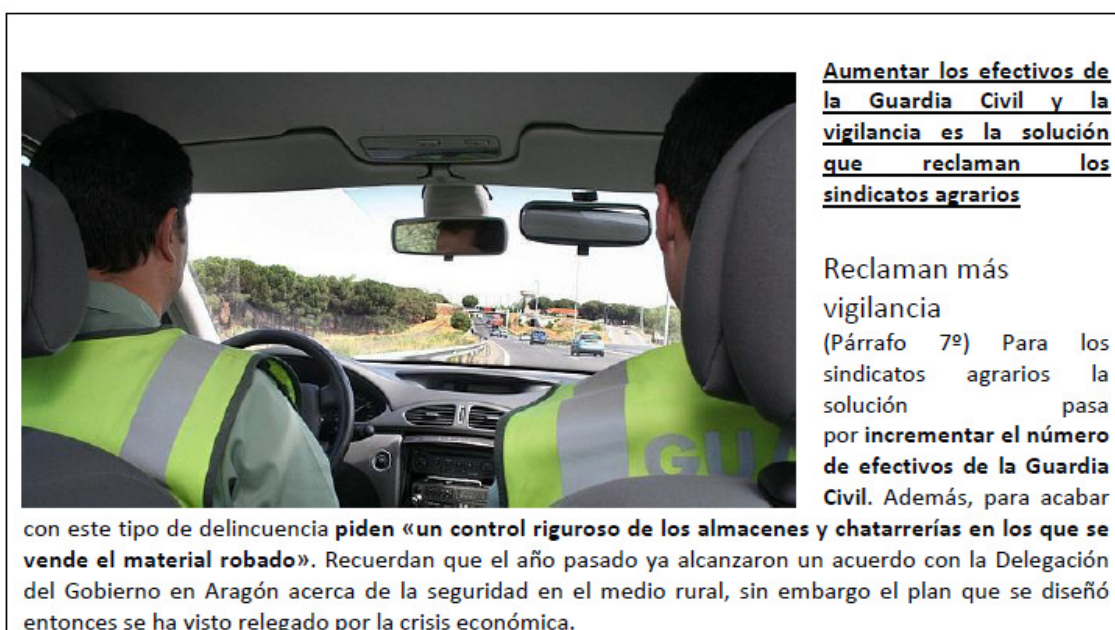
Figura 2: ABC, tribunales, El campo aragonés... 9

El siguiente ejemplo (Figura 2) muestra también una relación de igualdad entre la imagen y el texto. Se trata de una noticia que pertenece a la sección de Tribunales; el hecho noticiado es el aumento de robos en el campo aragonés y la exigencia de los agricultores de aumentar la vigilancia policial en el campo.