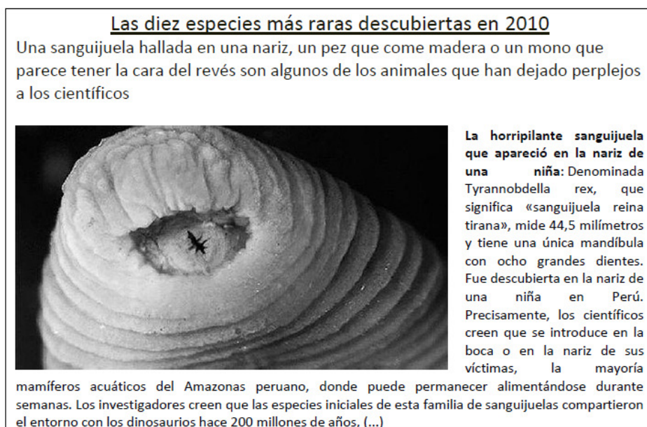
Figura 6: ABC, ciencia, Las diez especies más raras 14

subtítulo y el cuerpo del texto), sino que solo lo hace con una parte del texto contenida en el cuerpo de la noticia que especifica algunas de sus características 13 .