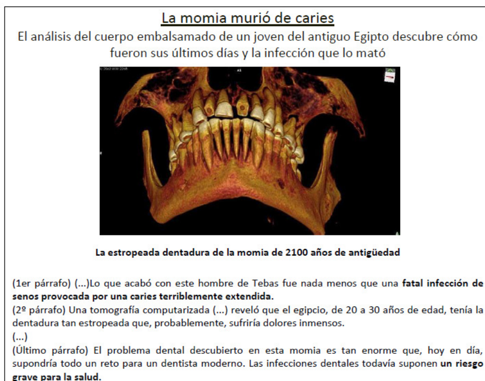
Figura 5: ABC, ciencia, La momia murió de caries 12

Un ejemplo de lo que acabamos de exponer puede verse en la relación que mantiene el texto (titular, subtítulo y cuerpo de la noticia) de la siguiente noticia (figura 5) sobre el descubrimiento de una momia y la imagen de la dentadura.