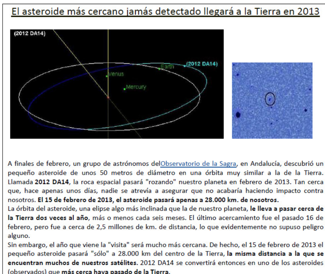
Figura 7: ABC, ciencia, El asteroide más cercano 17

(ideacional) de la imagen, sino que es el texto de la noticia el que lo expresa lingüísticamente. Por ello, tanto la imagen como las etiquetas se consideran imagen 16 . En estos casos, la proyección del significado se produce entre la explicación del texto y la idea que refleja la imagen, que reproduce gráficamente (esto es, simbólicamente) el contenido conceptual del texto.