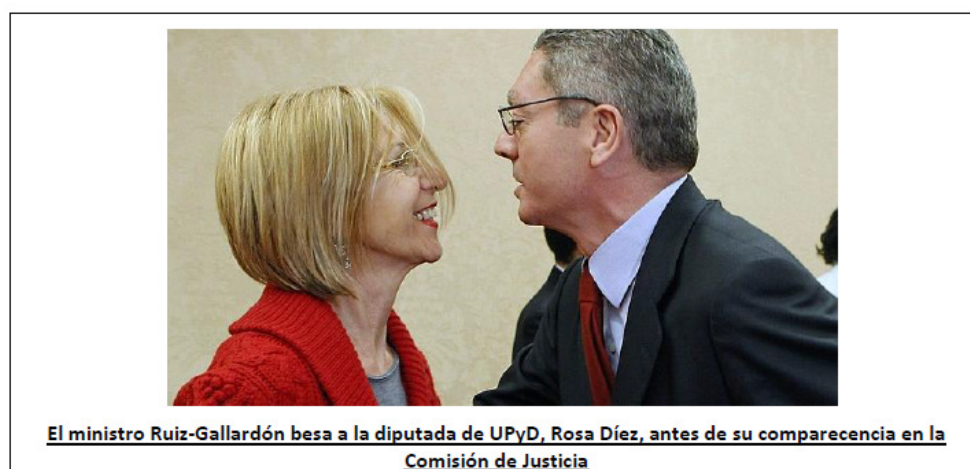
Figura 4: ABC, tribunales, El ejecutivo se plantea la prisión permanente revisable 11

La figura 4 muestra este tipo de relación. El pie de foto y la imagen expresan el mismo contenido y el texto describe el proceso de comportamiento representado.