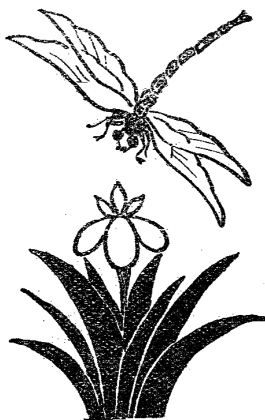
Ilustración de la revista Bordón , Tomo V, 1953.

Correo electrónico de contacto: rluengo@unex.es