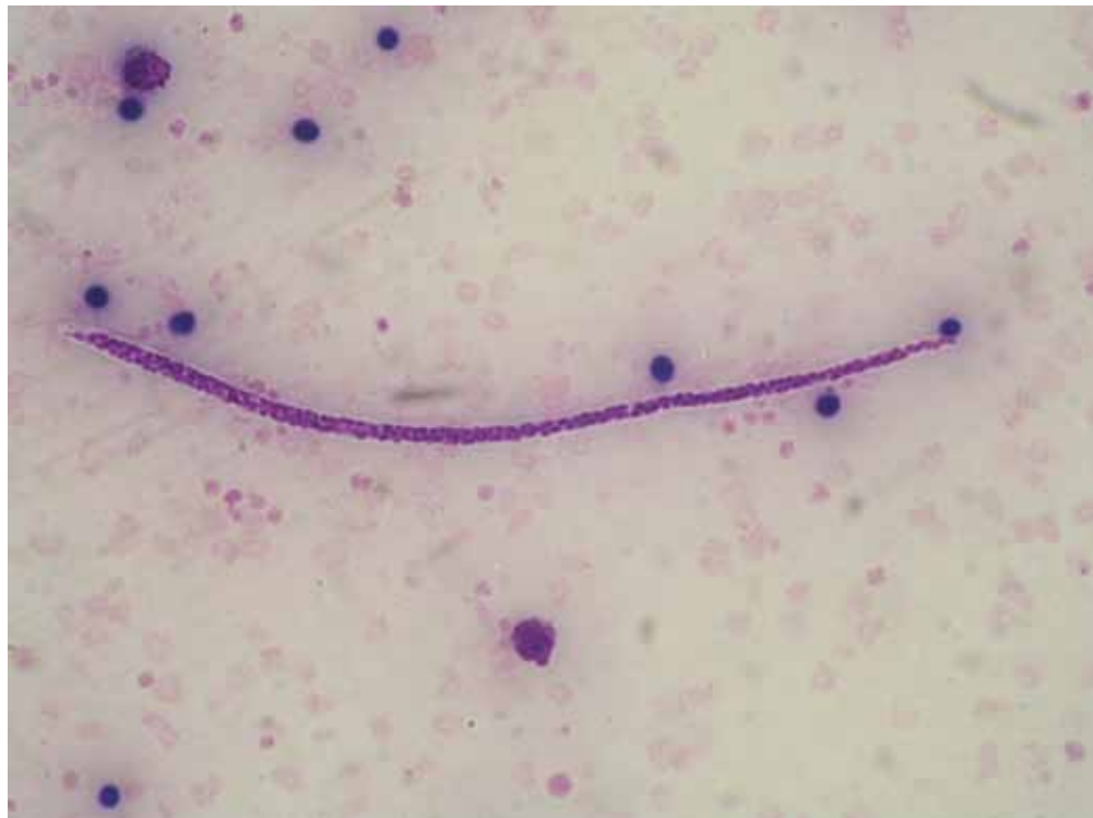
Figura 2. Microfilaria sin envainar: Mansonella perstans .

sis. En la segunda muestra de sangre periférica, tras concentración de Knott y tinción con Giemsa, se observaron microfilarias envainadas y sin envainar (Fig. 2).