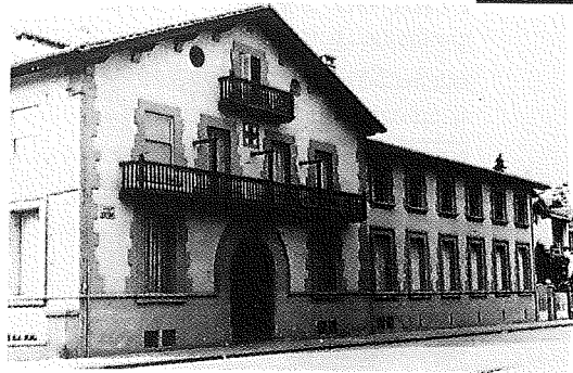
Dispensario Hospital de la Cruz Roja. 1951.