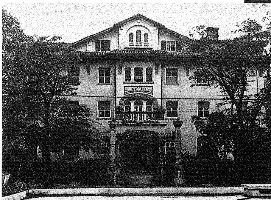
Clínica de San Miguel, fundada en 1919 en su emplazamiento en el barrio de San Juan, en la actual calle Monasterio de Tulebras.