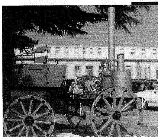
Brigada Sanitaria de Navarra, 1923. Carro de desinfección-fumigación, de tracción animal.