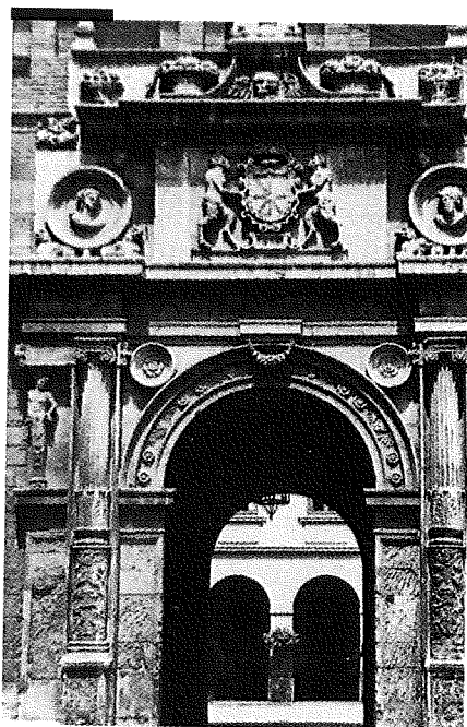
Hospital General de Pamplona. Abrió sus puertas entre 1545 y 1932 (Actual Museo de Navarra).