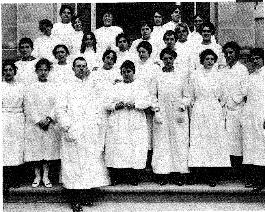
Primera promoción de Damas de Cruz Roja de Navarra en el curso de 1919.