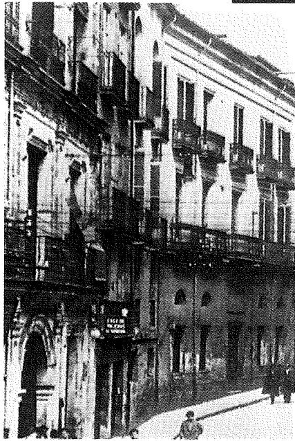
Casa Maternidad y Orfanato de Pamplona desde 1904 a 1934, situado en la calle del Carmen.