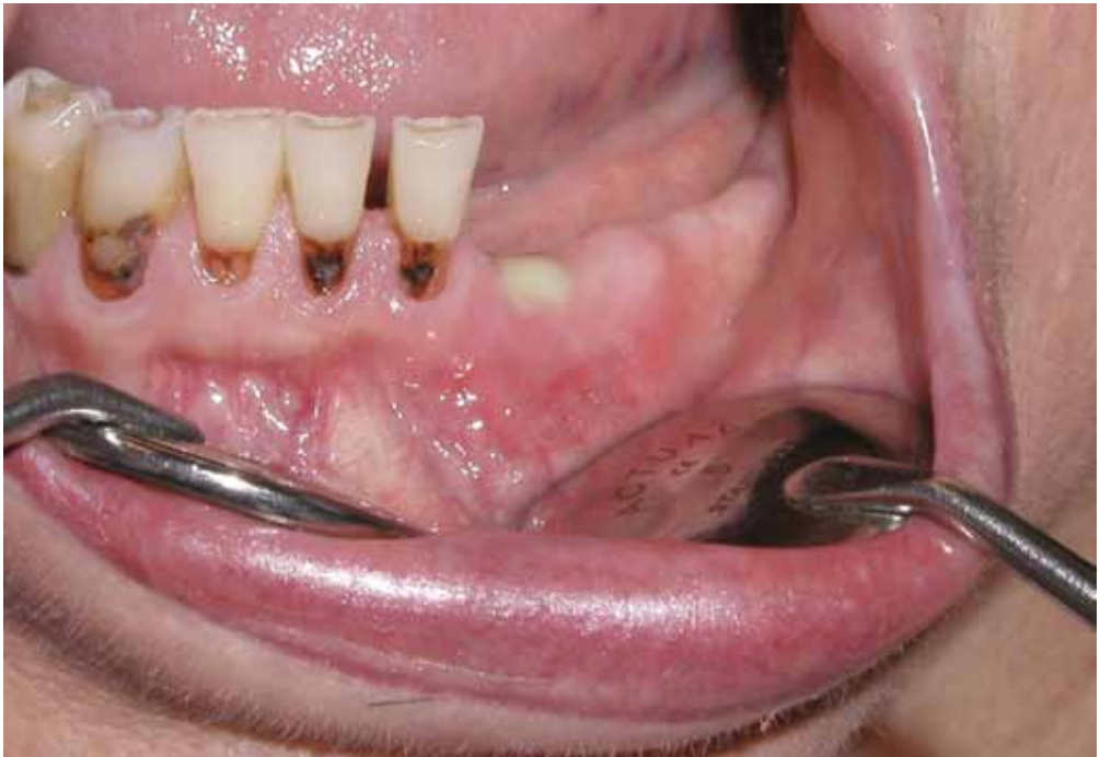
Figura 2. Caso clínico 1. Supuración crónica en la zona del incisivo lateral inferior izquierdo.

Paciente mujer de 60 años de edad, diagnosticada a los 56 años de un mieloma múltiple. Entre otros tratamientos recibió pamidronato intravenoso al menos 3 años y toma Actonel® semanal. Fue remitida a la Sección de Salud Bucodental porque tras la extracción simple del incisivo lateral inferior izquierdo el alveolo no curó, le realizaron un curetaje de dicho alveolo, pero siguió sin curar. Posteriormente le realizaron una cirugía a cielo abierto para limpiar y legar la zona de la extracción, pero no curó el proceso; así nos la remitieron unos 3 meses después de la extracción inicial. La paciente presentaba una supuración asintomática en la zona de la extracción (Fig. 2) y en la TC se apreciaba un gran secuestro en el interior (Fig. 3). Dada la escasa clínica se mantuvo una actitud expectante con higiene local y a los 6 meses se expulsó el secuestro solucionándose el proceso.