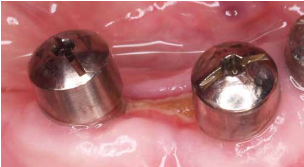
Figura 4. Caso clínico 2. Zona de hueso crónicamente expuesto entre dos implantes mandibulares.

Paciente mujer de 73 años de edad que toma Fosamax® desde hace 4 años. En esta Sección de Salud Bucodental se le extrajo a los 71 años el canino maxilar derecho incluido. Hace medio año le realizaron una rehabilitación oral implantoportada, tanto en maxilar como en mandíbula y desde hace un par de meses presenta una exposición ósea asintomática entre dos implantes mandibulares (Fig. 4) que no existía anteriormente. Se está manteniendo con tratamiento conservador.