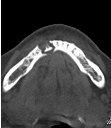
Figura 3. Caso clínico 1. TC que muestra el sequestro en el interior de la mandíbula en la zona del incisivo lateral izquierdo.