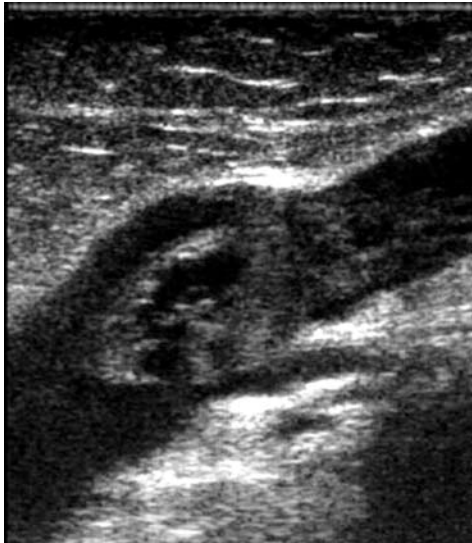
Figura 3. Imagen ecográfica de trombosis venosa.

El diagnóstico suele confirmarse con Eco-doppler de extremidad afectada (Fig. 3), y en escasas ocasiones hace falta flebografía, prueba "gold standard".