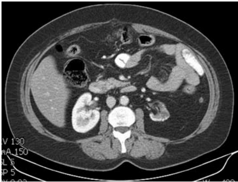
Figura 2. Necrosis renal cortical por obstrucción ureteral izquierda.