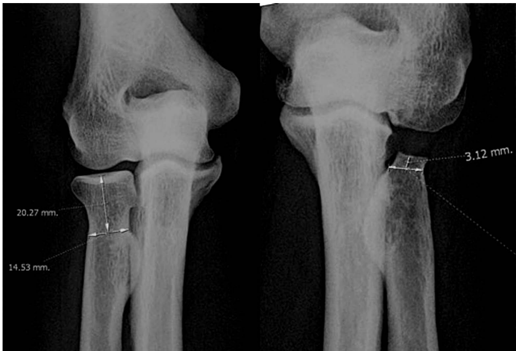
Figura 2. Valoración del acortamiento del muñón proximal del radio.

Se ha realizado un estudio radiológico a todos los pacientes que incluye proyecciones postero-anterior y lateral de ambos codos y antebrazos. Las determinaciones estudiadas son la presencia y grado de artrosis en el codo según la clasificación de Broberg y Morrey 21 (grado cero o radiografía normal, grado 1 o pinzamiento leve, grado 2 o pinzamiento moderado y 3 o cambios degenerativos severos). Se ha valorado la presencia y localización de calcificaciones periarticulares 21 y se ha medido también el acortamiento del muñón proximal del radio en la radiografía antero-posterior de codo. Esta última medida es la diferencia entre la distancia desde la porción más proximal de la tuberosidad del radio hasta la porción proximal de la cabeza radial en el lado sano y al muñón radial en el afecto (Fig. 2). Final-