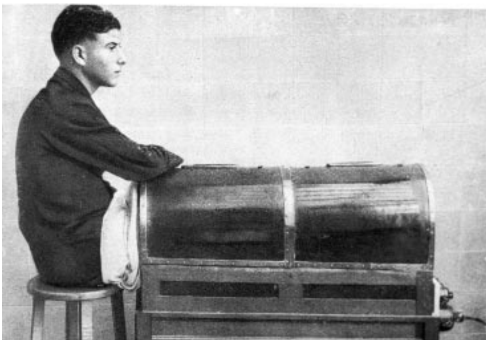
Figura 4. Paciente con la extremidad en una cámara de aire caliente. Los resultados de aplicación de diferentes medios físicos a los afectados de congelaciones fueron controvertidos.

Como hemos visto, a pesar de los diversos tratamientos aplicados en los hospitales de guerra navarros, cerca del 20% de los pacientes atendidos por congelaciones padecidas en la batalla de Teruel sufrieron algún tipo de resección parcial en estos centros, en la inmensa mayoría de los casos falanges o dedos del pie. Por las estadísticas oficiales, sabemos que las amputaciones completas del miembro fueron excepcionales y se aplicaron únicamente al 2,4% de los afectados. También podemos afirmar que la mortalidad de las lesiones en estos hospitales de retaguardia fue muy baja. De los 375 casos oficialmente contabilizados en la provincia únicamente queda constan-