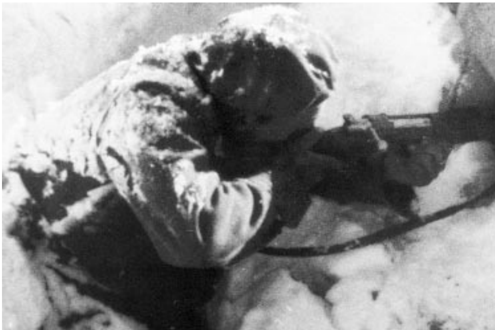
Figura 2. Requeté del Tercio Navarra disparando desde las trincheras de “La Muela”, a las afueras de Teruel. Los “pies de trincherera” se debían a la inmersión del pie durante horas en barro, nieve o agua fría.

Sin embargo, sabemos que este registro fue incompleto, ya que, según el testimonio de personas que participaron en su elaboración, recogió únicamente aquellos ingresos en que las lesiones por congela-