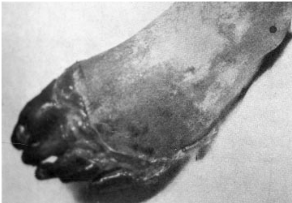
Figura 3. Imagen de un pie con gangrena seca obtenida en el Hospital Provincial. En la base de las falanges se aprecia la "línea de demarcación de la gangrena" y, más proximal, la denominada zona intermedia de regeneración.

La amputación completa del miembro lesionado se utilizó como último recurso en situaciones extremas, como sepsis y toxemias, que conllevaran riesgo vital para el paciente. Además, existía el problema sobreañadido de la persistencia de una zona de insuficiencia circulatoria por encima del muñón de amputación que dificultaba la posterior aplicación de prótesis ortopédicas en estos pacientes 28 . Los pocos casos en que se practicaron resecciones completas de miembros en los establecimientos navarros están bien documentados: cuatro en el Hospital Militar de Pamplona, tres gangrenas secas y un pie de trinchera; y cinco en el Hospital Provincial de Barañáin, dos gangrenas secas y dos húmedas en extremidades inferiores, y la amputación de un antebrazo "momificado" 21 . Todos ellos suponían un escaso 2,4% del total de ingresos por congelaciones del registro oficial.