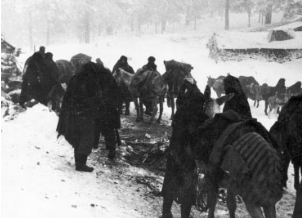
Figura 1. Columna de acemileros de la Primera División de Navarra en las inmediaciones de la ciudad de Teruel. Las condiciones meteorológicas fueron excepcionales durante la batalla, con temperaturas de hasta veinte grados centígrados bajo cero.

bataban la manta, era como si le firmasen su condena de muerte. Por las noches se apretujaban unos a otros, temblando, en busca de algo de calor 12 .