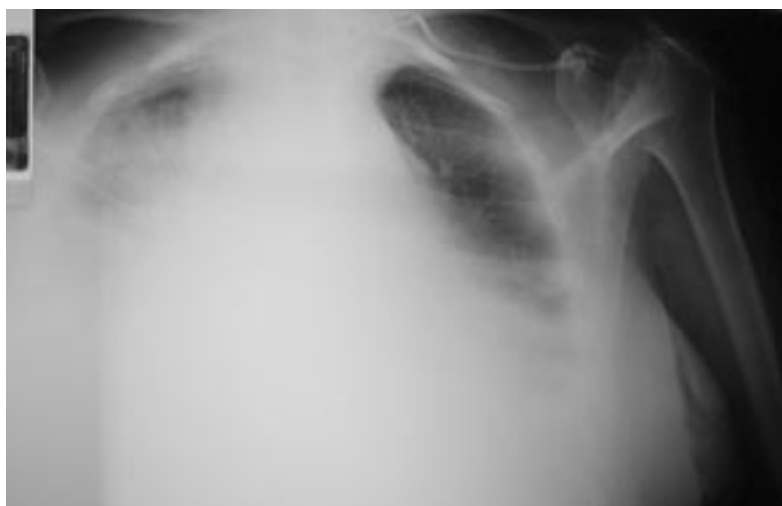
Figura 1. Rx tórax: derrame pleural bilateral con ensanchamiento del mediastino.

Se realiza TC toracoabdominopélvico (Fig. 2) apreciándose importante derrame pleural bilateral con atelectasia de ambos lóbulos inferiores; mínima cantidad de líquido libre abdominal y neumoperitoneo secundarios a la intervención quirúrgica. Se procede a la colocación de dos drenajes torácicos obteniéndose líquido blanquecino lechoso (con débito total derecho de 1.550 ml e izquierdo aproximadamente de 270 ml).