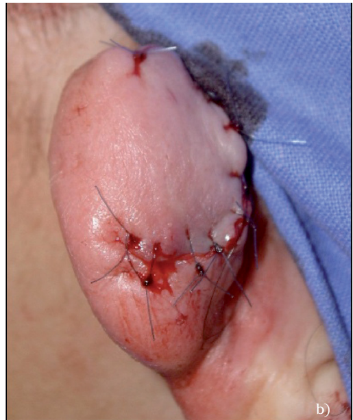
Figura 2. Diseción de colgajo queloideo (a). Reparación del defecto tras extirpación del resto del que-loide (b).

El colgajo de la oreja derecha presentó una dehiscencia pequeña de sutura, la cual curó por segunda intención a las pocas semanas mediante tratamiento tópico. No se desarrollaron necrosis u otras complicaciones. Se logró una reparación de los defectos satisfactoria, con restitución del contorno normal de las orejas. En la oreja dere-