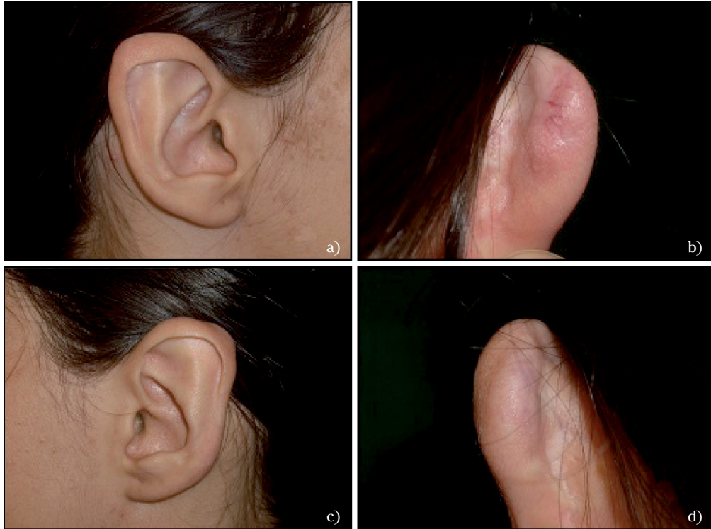
Figura 3. Resultado a los 6 años de la intervención. Oreja derecha: Aspecto lateral (a). Aspecto postero-medial (b). Oreja izquierda: Aspecto lateral (c). Aspecto posteromedial (d).