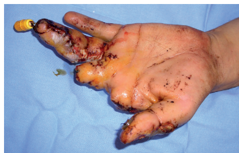
Figura 2b. Postoperatorio inmediato de la intervención de urgencia visión palmar.

La función de la pinza entre 1º y 4º ó 5º dedos no era plenamente satisfactoria. Por este motivo se optó por la reconstrucción del 3º dedo de la mano con una transposición total microquirúrgica del 2º dedo del pie ipsilateral 5 .