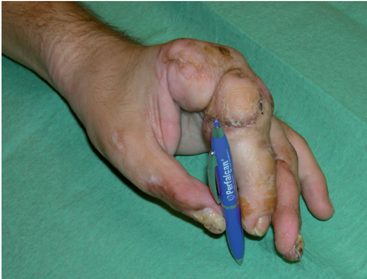
Figura 4. Resultado al 3º mes postoperatorio.