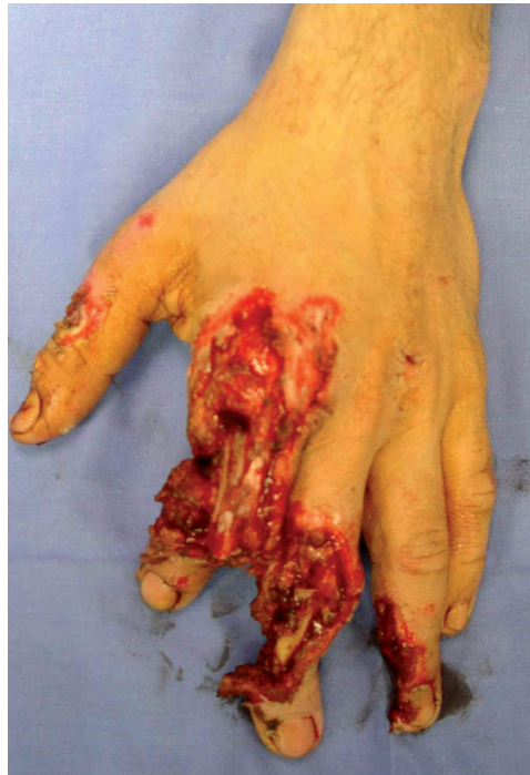
Figura 1. Estado de la mano a su llegada a urgencias.

El resultado de esta primera intervención de urgencia fue una mano con 1º, 4º y 5º dedos funcionales (Fig. 2).