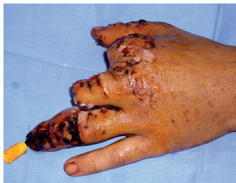
Figura 2a. Postoperatorio inmediato de la intervención de urgencia visión dorsal.