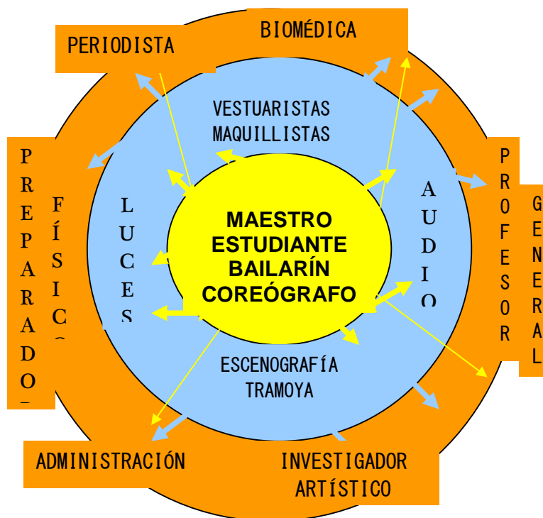
IMAGEN 2. Distribución jerárquica de las posiciones sociales del campo danzario del ballet en Cuba (Elaboración propia).

El danzar públicamente estructura completamente el campo del ballet (define temporalmente al más apto), pues todas las prácticas sociales son reglas del campo únicamente cuando tributan directa o indirectamente a la consecución de este sueño de niño. Las prácticas sociales que no explicitan la fantasía de bailar son realizadas por “los protagonistas” sólo en la medida que las relaciones con “los otros” - fundamentalmente la familia y el poder político- se lo imponen como parte de su vida social o como actividades recreativas en su tiempo libre (previamente conocimiento de su inocuidad para el ballet).