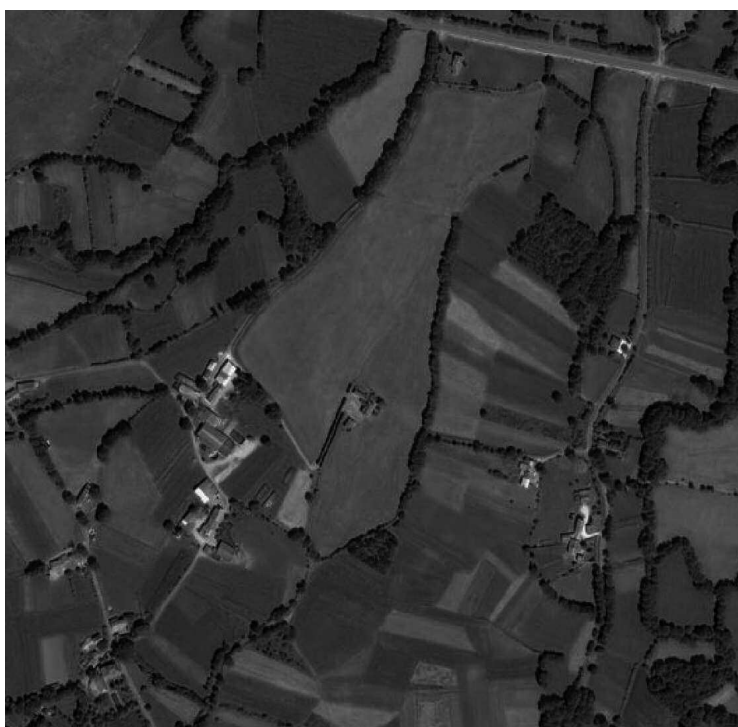
Figura 4. Vista aérea de una agra en la parroquia de Goá, municipio de Cospeito (Lugo)

La supervivencia de su forma tradicional de uso (hasta finales de los noventa) y la conservación de la mayor parte de su morfología la convierten en uno de los últimos vestigios de lo que fue el "paisaje cultural" de la comarca.