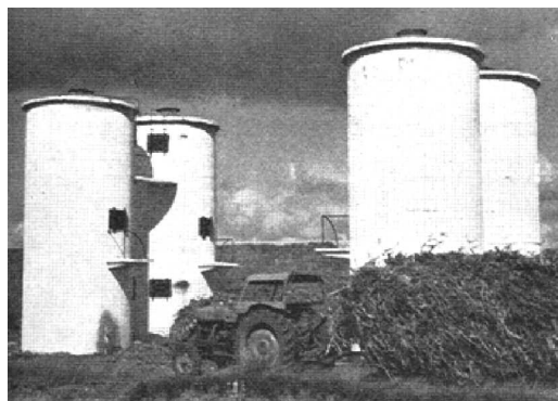
Figura 3. Vista de los silos construidos en la colonización y croquis del área colonizada de A Espiñeira (1966)

mutación del metabolismo social. Dicho cambio metabólico forzoso desestructuró el estilo de manejo de los recursos naturales de los agroecosistemas, las formas de sociabilidad y una buena parte de los elementos identitarios de la sociedad local. La transformación del metabolismo fue radical y bien visible: de un monte bajo, donde dominaban tojales y brezales (insustituible abono para las agras) y en el que estas se completaban con las parcelas cultivadas de cereal (trigo sobre todo) en el monte mediante el sistema de rozas o estivadas, se pasó a una zona en la que praderas artificiales, acequias, silos cilíndricos, casas encaladas y los enormes campanarios de las iglesias de los pueblos de colonización dominan el espacio 16 . Se trata de la transformación de un paisaje cultural, el monte comunal y las agras, en un protopaisaje, un nuevo escenario totalmente ajeno a la realidad de la zona, sin aceptación social, nada connotado ni simbólico.