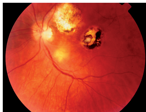
Figura 3. Toxoplasmosis ocular. Los focos antiguos se observan cicatrizados con áreas de hipo e hiperpigmentación y bordes nítidos. El foco de reactivación se observa de color blanquecino con borde más difuso.

Causada por un gusano intestinal común en los perros denominado Toxocara canis , la infestación humana puede deberse a la ingestión de tierra o alimentos contaminados con huevos eliminados de las heces de los perros. En el intestino los