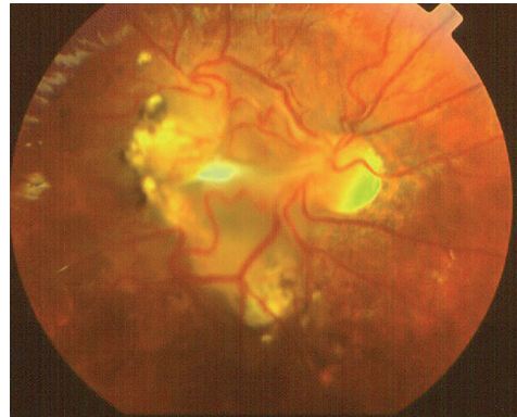
Figura 4. Granuloma por toxocariasis que produce deformidad retiniana en un niño de 10 años.

son heterotopia macular y desprendimiento de retina traccional.