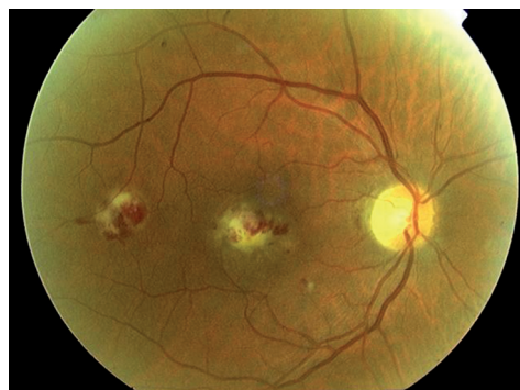
Figura 2. Retinitis por Citomegalovirus de localización macular en un paciente inmunodeprimido por un linfoma en tratamiento con quimioterapia y radioterapia.

En neonatos, la retinitis congénita generalmente se asocia a otras manifestaciones sistémicas de una infección diseminada, como fiebre, anemia, trombocitopenia, neumonía y hepatoesplenomegalia. Sin embargo, la retinitis por CMV se desarrolla en etapas posteriores en niños sin indicios de reactivación del proceso sistémico.